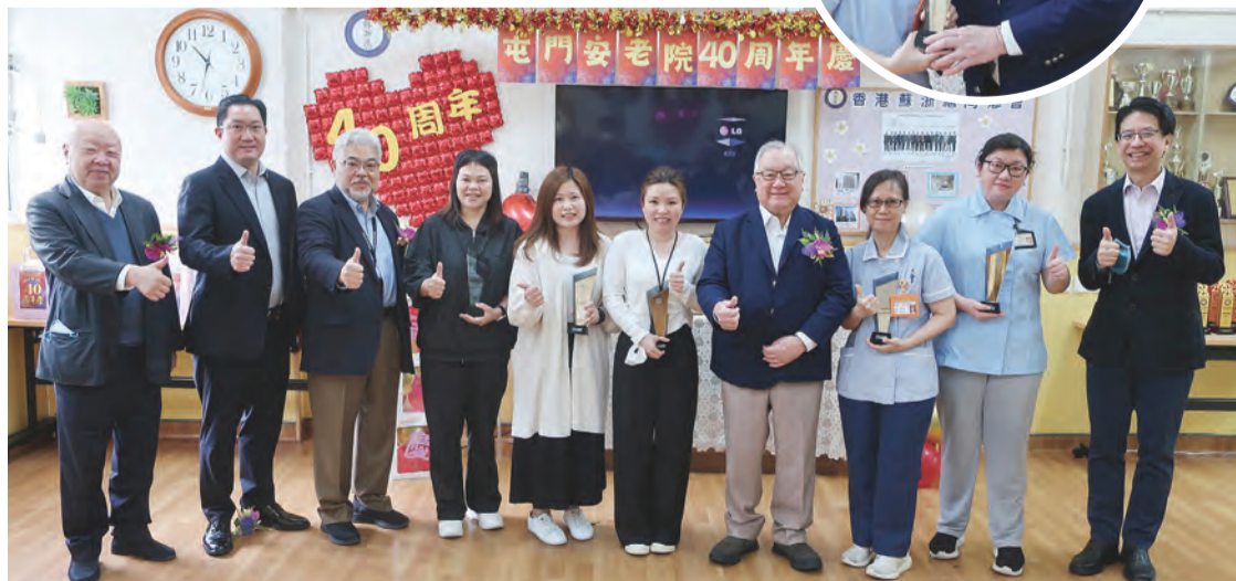
主禮嘉賓與護老院優秀員工獎得主合影