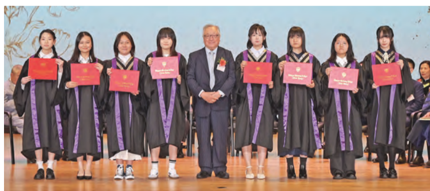
張浩然會長頒發畢業證書予中六級畢業生