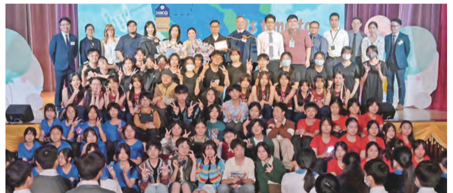
同學演出英語音樂劇後與老師及嘉賓合影