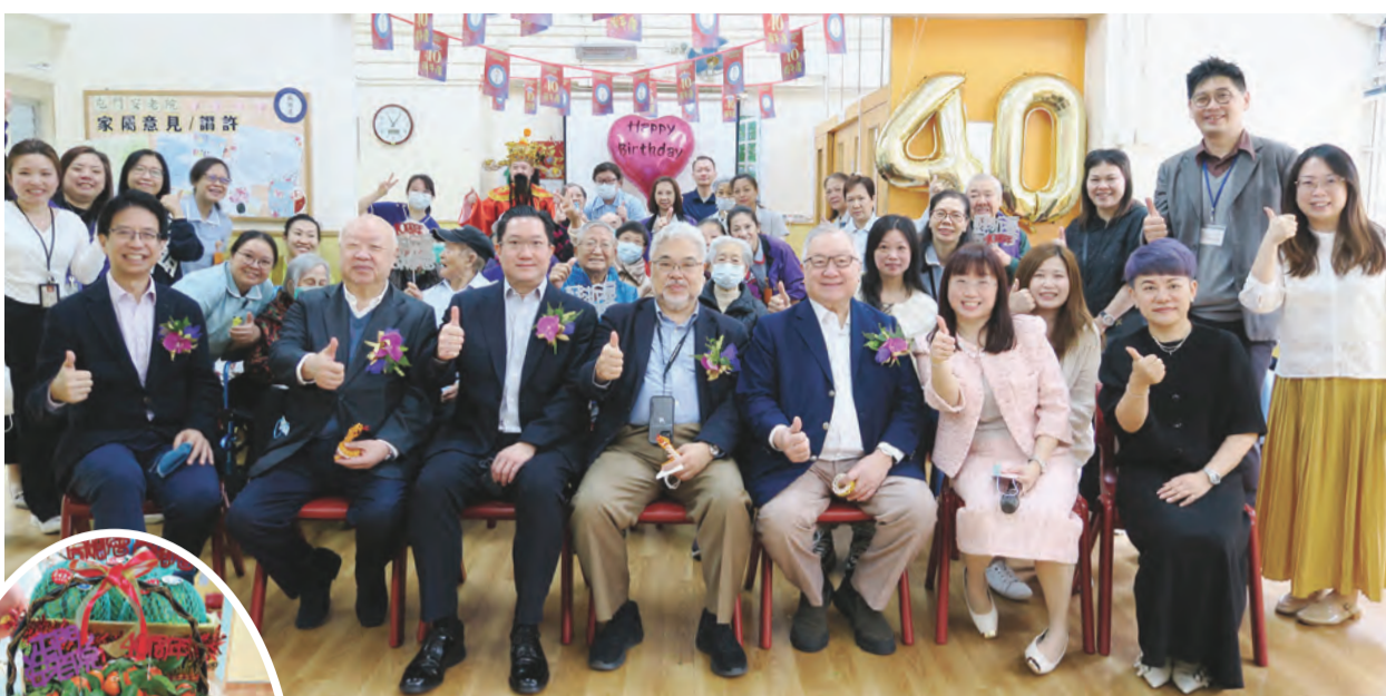
主禮嘉賓、職員及來賓合影