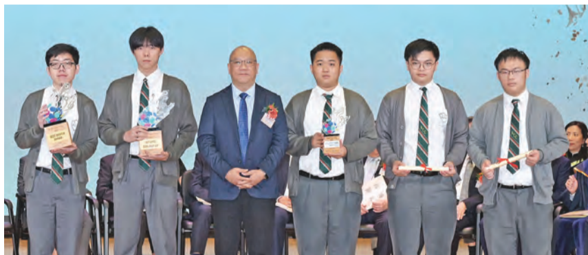
李語容會董頒發2024鵬程盃足球機械人大賽 分組賽冠軍、比賽季軍、最佳設計獎