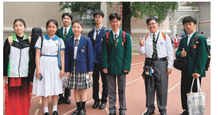
兩校學生在才藝表演後合影留念