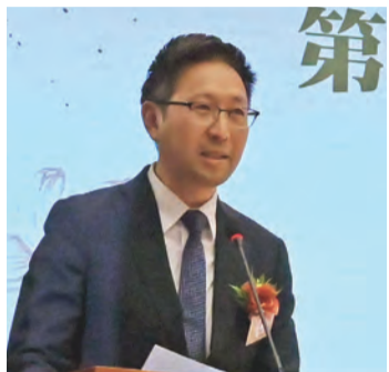
主禮嘉賓文化體育及旅遊局局長政治助理招文亮先生致辭

卡拉O不侍應、人口普查員、私人補習老師、考評局核卷員等多份工作，有些崗位每天的工作時間超過十小時，回到家時常感到筋疲力盡，渾身酸痛。每月賺取幾千元工資的艱辛，讓我更深刻明白，若想改變命運，唯有加倍努力讀書，提升自己。