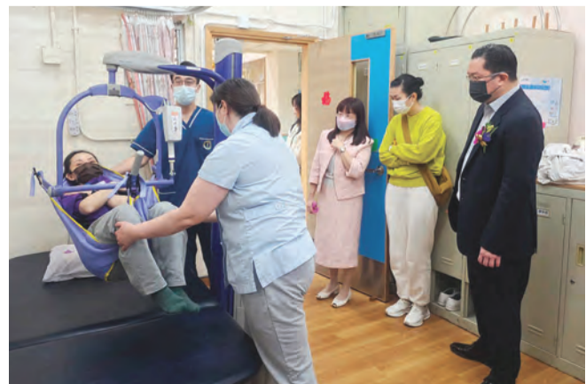
樂齡科技融入院舍生活