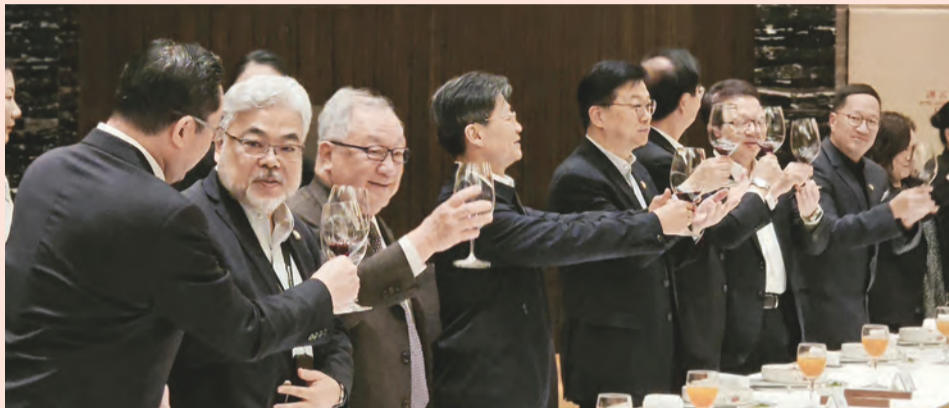
江蘇省委統戰部宴請本會訪問團一行