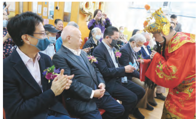
財神送福：金銀滿屋，福壽滿堂