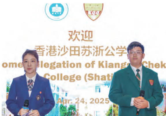
兩校學生才藝表演