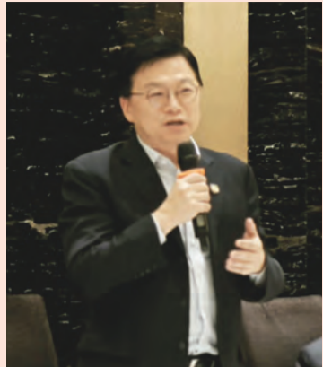
江蘇省政協委員吳德龍副會長致辭