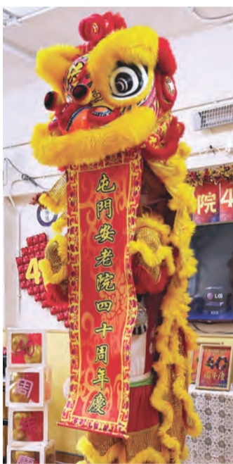
醒獅賀壽：鑼鼓聲中見傳承