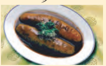
圖：蝦子蔥燒大烏參

餐廳地址：香港皇后大道中38-48號萬年大廈3-4樓 電話：2526 3251 傳真：2525 7943