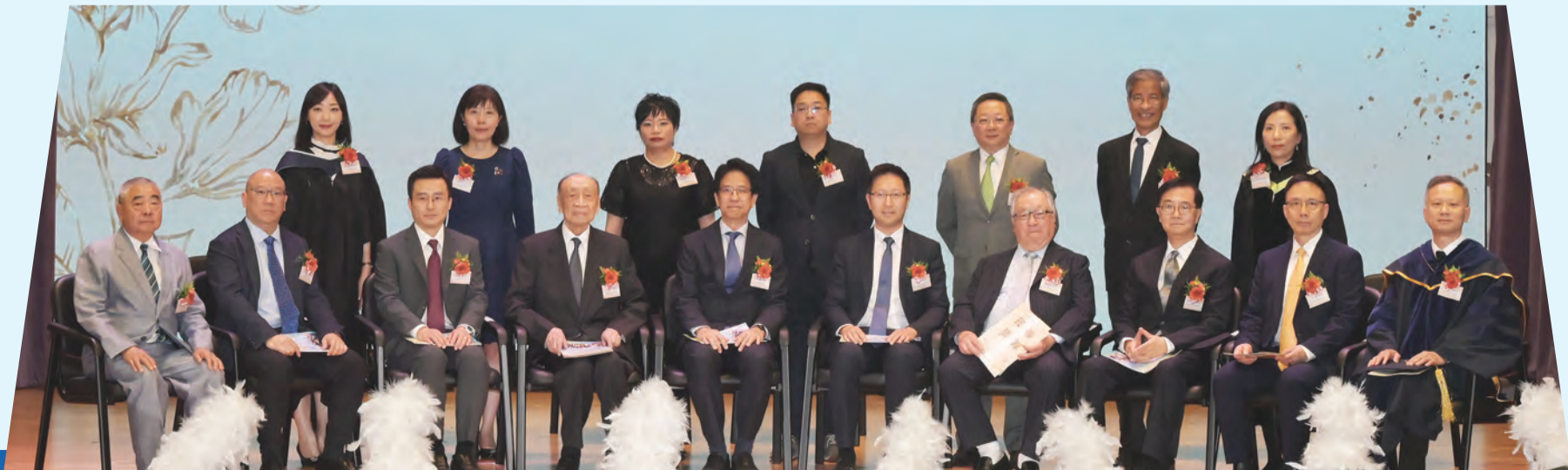
葵涌蘇浙公學第四十二屆畢業典禮主禮嘉賓團合照