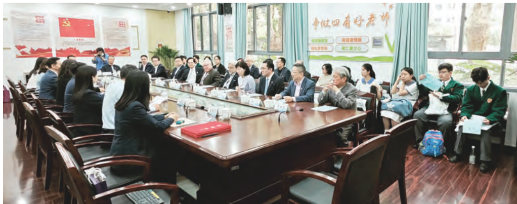
兩校代表在交流會上互相介紹各自的歷史與特色